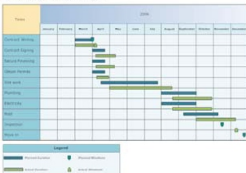
Residential Construction Schedule